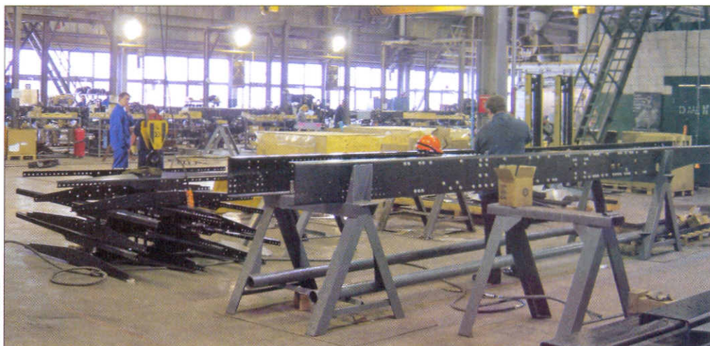
ПЕРВЫЙ ШАГ К ПОЯВЛЕНИЮ НА СВЕТ IVECO TRAKKER – ИЗГОТОВЛЕНИЕ МОЩНОЙ ЛОНЖЕРОННОЙ РАМЫ

П роизводство на расположенном в Миассе российско-итальянском СП организовано таким образом, что практически все операции по изготовлению Iveco Trakker осуществляются под одной крышей: если в начале сборочного цеха тебя встречают штабеля лонжеронов и поперечин для будущих рам, то с противоположной стороны, возле ворот, ведущих на площадку готовой продукции, можно увидеть уже полностью собранные автомобили. Но это не значит, что здесь, как на некоторых других производствах, к почти полностью сделанным на чужбине машинам привин-