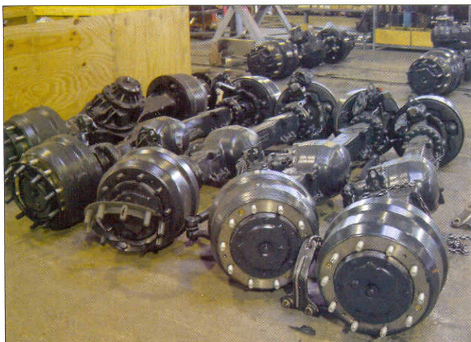
ДАЖЕ УПРАВЛЯЕМЫЕ МОСТЫ – С КАРТЕРАМИ ГЛАВНОЙ ПЕРЕДАЧИ. ВЕДЬ ДЕВЯТЬ ИЗ ДЕСЯТИ РОССИЙСКИХ «ТРАККЕРОВ» – ПОЛНОПРИВОДНИКИ